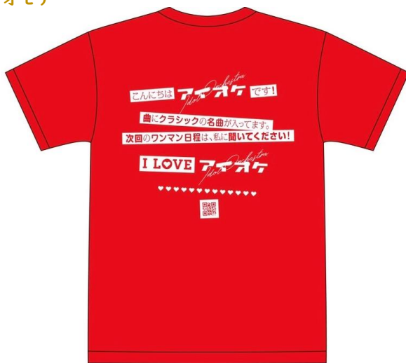
ビビッドレッド/ウラ